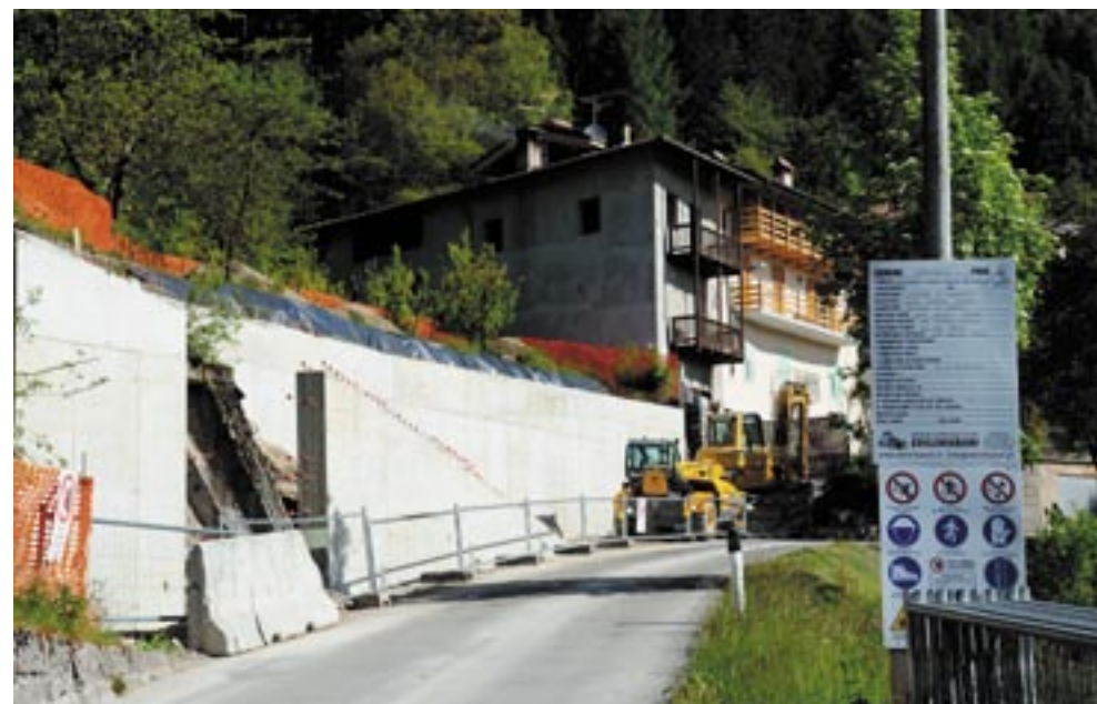
Strada delle Frate di Seo

di completamento la variante puntuale per opera pubblica per la delocalizzazione della caserma. Valutata la disponibilità dell'area, la morfologia e la possibilità di accesso è stato ritenuto idoneo l'appezzamento identificato dalle pp. ff. 1163-1166 e p. ed 687 che si trovano lungo la SP. 33 di Stenico e Villa Banale alla periferia ad est dell'abitato di Stenico.