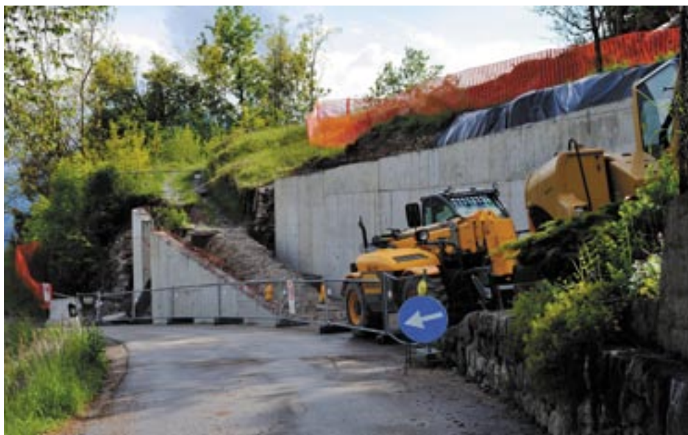
Strada delle Frate di Seo